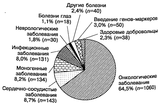
Рис. 2. КИ генотерапевтических препаратов: распределение по заболеваниям (по данным Journal of Gene Medicine http://www.wiley.com/legacy/wileychi/genmed/clinical/ на 30 июня 2010 г.).

Наиболее впечатляющий результат получен в итальянском исследовании. Генетическая модификация аутологических гемопоэтических стволовых клеток (ГСК) нормальным геном АДА привела к успешному излечению 8 из 10 детей. После пересадки клеток традиционная заместительная терапия была приостановлена в целях обеспечения селективного преимущества пересаженных клеток над немодифицированными клетками. Трансгенный фермент экспрессировался как в лимфоцитах, так и в миелоидных клетках, обеспечивая системную детоксикацию и восстановление функций иммунной системы [9]. В течение последних 8 лет дети не нуждаются в заместительной ферментативной терапии, дают нормальный иммунный ответ при вакцинации и живут обычной жизнью, посещая школу. По заверше-