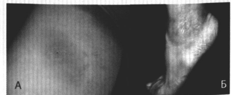
Рис. 3. А. Клещевая мигрирующая эритема; Б. Хронический атрофический акродерматит.

неврит черепных нервов. Наиболее часто поражается VII пара, нередко с парезом лицевых мышц, что является еще одним, кроме КМЭ, характерным признаком ИКБ. В ряде случаев, особенно при поздно начатом лечении, заболевание переходит в третью — хроническую — стадию, для которой в настоящее время доказана только одна клиническая форма — хронический атрофический акродерматит — ХААД (рис. 3Б).